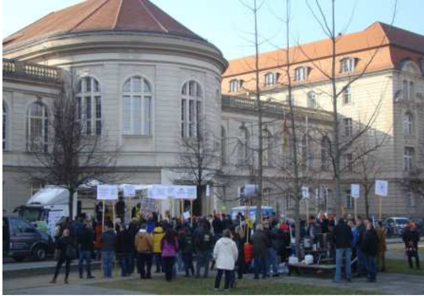
Demo „Rettet die Energiewende“ am 20.02.2014 vor dem Bundeswirtschaftsministerium in Berlin